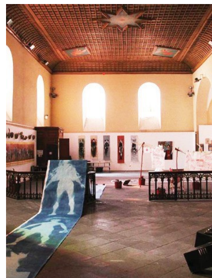
La visitation

Brioude est également devenue un haut lieu de l'art moderne avec l'ouverture du Doyenné . Ce centre d'art moderne et contemporain propose des expositions d'envergure internationale mettant en valeur des artistes du XXème siècle comme Chagall (2018), Miró (2019), Nicolas de Staël (2021) ou encore Picasso (2022) et contemporain avec l'exposition d'Ernest Pignon-Ernest en 2023. Elle accueille chaque année en moyenne 35 000 visiteurs sur sa période d'ouverture, entre les mois de juin et d'octobre.