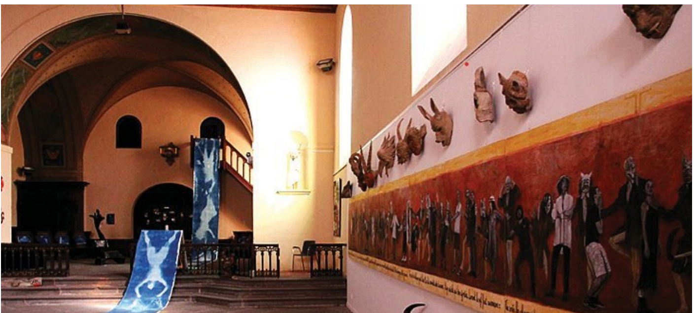
La visitation photo : Diane Cazelles