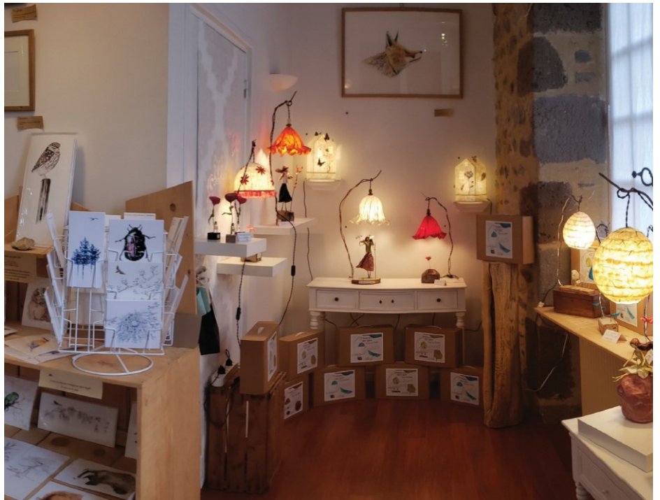
Boutique Reg'Art d'Ateliers

Pour participer à ce salon, vous devez :