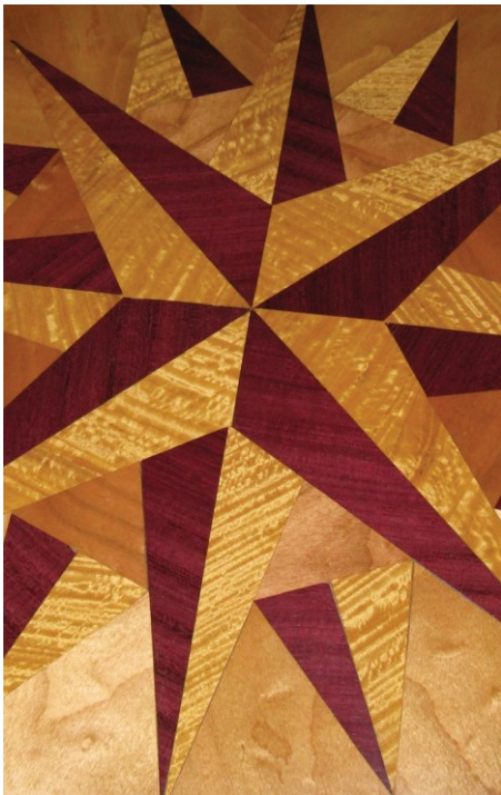
Atelier de Rochely