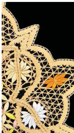
Hotel de la dentelle